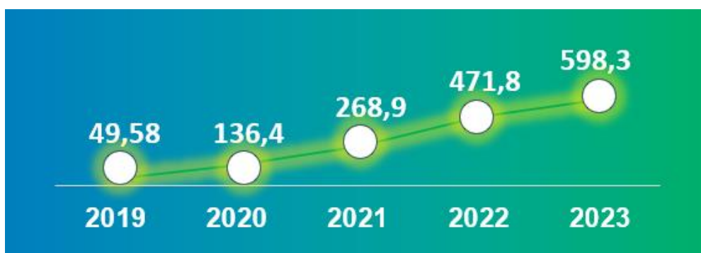
Рис. Количество граждан, расселенных из непригодного для проживания жилищного фонда за 2019-2023 годы, тыс. человек

По инициативе Президента Российской Федерации успешно реализуются несколько федеральных проектов , в том числе «Обеспечение устойчивого сокращения непригодного для проживания жилищного фонда» . Из запланированных к расселению к концу 2024 года 536 тыс. человек, 531 тыс. уже расселены.