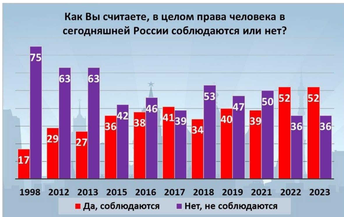
Оценка населением соблюдения прав человека в России в 1998–2023 годах, в %