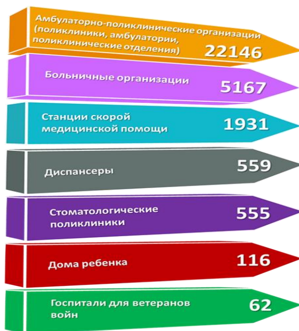
Рис. Количество в России учреждений и организации здравоохранения в 2023 году

В Российской Федерации постоянно расширяются гарантии права на охрану здоровья и медицинскую помощь.