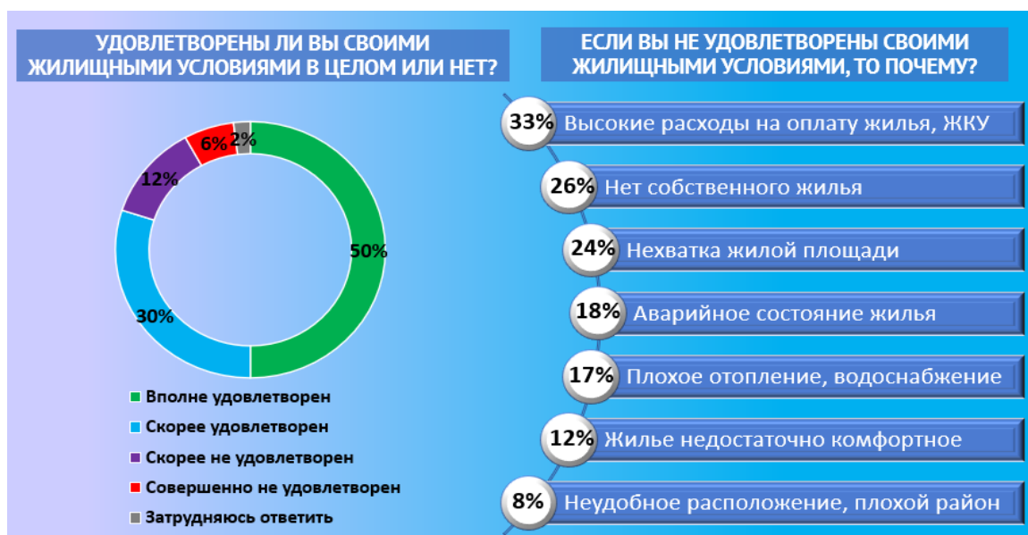
Рис. Степень удовлетворенности граждан жилищными условиями. Результаты опроса ВЦИОМ (24 сентября 2023 г., 1600 россиян в возрасте от 18 лет)

12) принят долгожданный закон об отмене банковских комиссий при оплате коммунальных платежей категорий граждан, которым необходима поддержка (Федеральный закон от 19.12.2023 № 602-ФЗ).