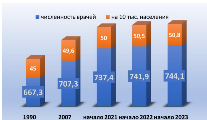
Рис. Численность врачей (до, через год после начала реализации Национального проекта «Здравоохранение»)

Реализуется национальный проект «Здравоохранение». Его мероприятия позволили снизить на 6,8% младенческую смертность, завершить строительство и ввод в эксплуатацию 818 объектов первичного звена, 8 онкологических больниц, 15 детских больниц, создать 497 центров амбулаторной онкологической помощи и 3589 фельдшерско-акушерских пунктов. Закуплено и введено 1617 передвижных медицинских комплексов.