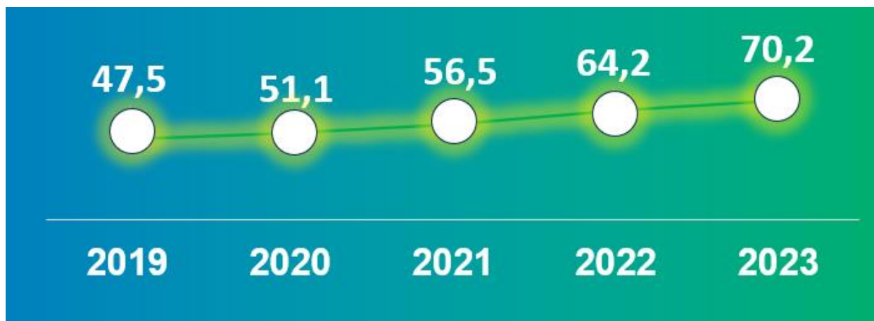
Рис. Уровень средней номинальной заработной платы за 2019-2023 годы, тыс. рублей

Президент Российской Федерации в своем указе от 21 июля 2020 г. № 474 «О национальных целях развития Российской Федерации на период до 2030 года» важнейшими целями обозначил «Сохранение населения, здоровье и благополучие людей» и «Достойный, эффективный труд и успешное предпринимательство», целевыми показателями которых являются снижение уровня бедности в два раза по сравнению с показателем 2017 года и обеспечение темпа устойчивого роста доходов населения не ниже инфляции.