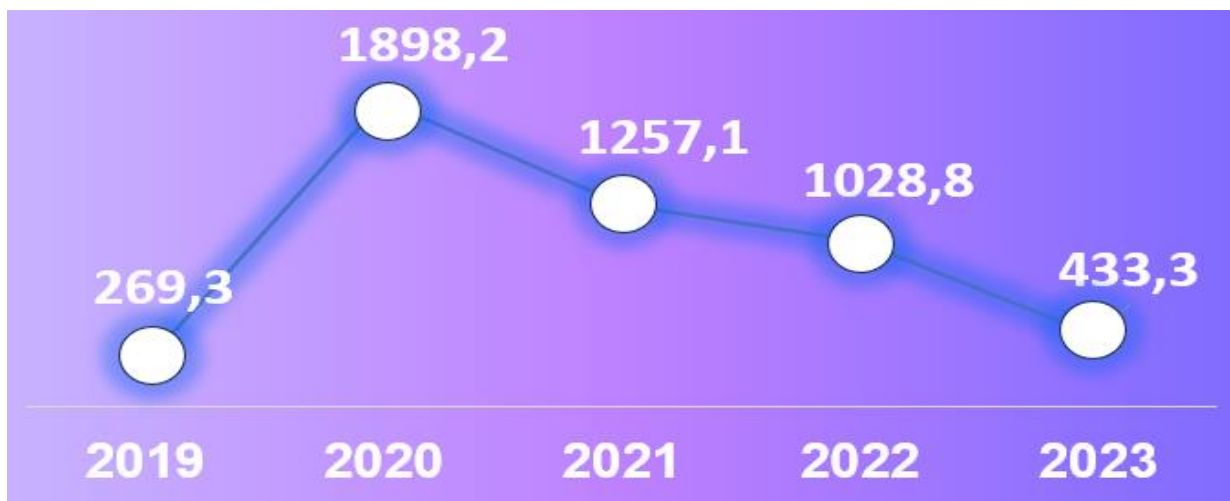
Рис. Суммарный размер задолженности по заработной плате за 2019-2023 годы (по состоянию на конец года), млн рублей

Снижение уровня бедности обеспечивается путем систематического увеличения минимального размера оплаты труда (в 2024 г. – 19 242 руб. в месяц) на уровне, превышающем величину прожиточного минимума трудоспособного населения (в 2023 г. – 15 669 руб.), что способствует росту благосостояния граждан и снижению уровня бедности.